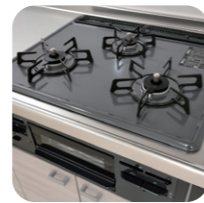
ガスコンロ・IHヒーター