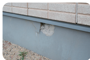
基礎コンクリート